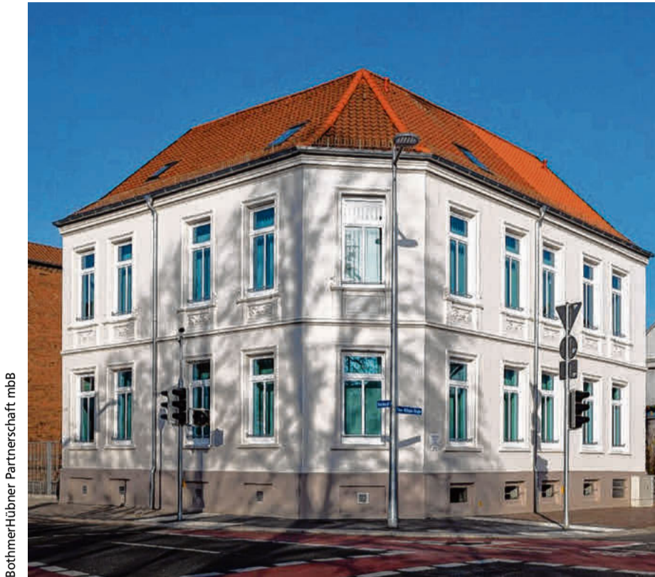
BothmerHübner Partnerschaft mbB

Dementsprechend bedeutete dies, das äußere Erscheinungsbild behutsam und mit nur wenigen Änderungen anzugehen. So wurde lediglich ein zum Treppenhaus angrenzender Anbau sowie ein nicht erhaltenswürdiger Erker abgebrochen. Außerdem wurde der bisherige, straßenseitige Haupteingang geschlossen, um dort – zur Herstellung eines harmonischen Gesamtbildes – eine Fensteröffnung entsprechend den vorhandenen Fenstern auszuführen. Der Eingang befindet sich nun auf der Rückseite des