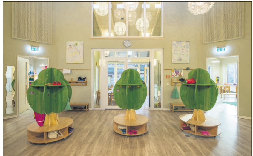
Mit Garderobenbäumchen aus Holz und Pusteblumenlampen ist der Eingangsbereich dekoriert.